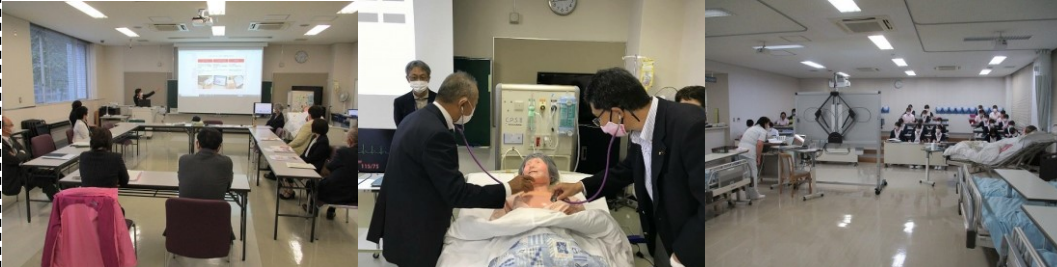
文教民生委員会で富士市立看護学校を視察(5/27)・・・看護師育成のプログラムが高度化・多様化する中で、4年制化を含めた看護学校のあり方を検討していく必要性を実感しました！