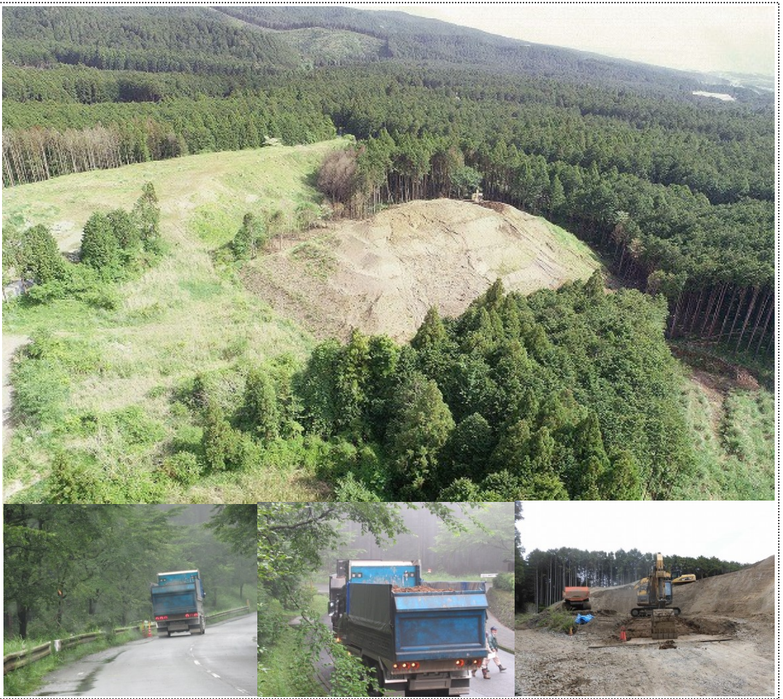
■大淵・吉永北地区に20数ヶ所が確認されている違法土砂埋立て現場と、大量の土砂を積んだダンプカー

(市長)人事交流で警察職員を受け入れた場合、その職員は市職員と同じ身分となり、警察の捜査権を行使できなくなる。警察職員を受け入れる以外の方法で、警察と緊密に連携を取れる体制を構築していきたい。