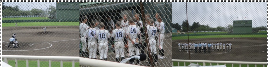
久しぶりに夏の高校野球を球場で応援(7/11)・・・富士球場に母校・富士高の1回戦の応援に出かけました。前日の富士市立に続く7-0のコールド勝ちで、球場で聞く校歌に感激しました！