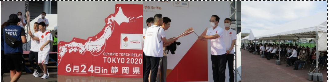
東京2020オリンピック聖火リレー(6/24)・・・ふじさんめっせでトーチへの点灯式と出発式が行われ、中央公園までの2.6kmをリレー方式で13人のランナーが聖火をつなぎました！