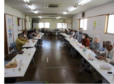
駿河台3丁目の「サロンなごみ」の総会(4/22)・・・今年は新たに大正琴のグループが誕生し、総会で演奏が披露されました！