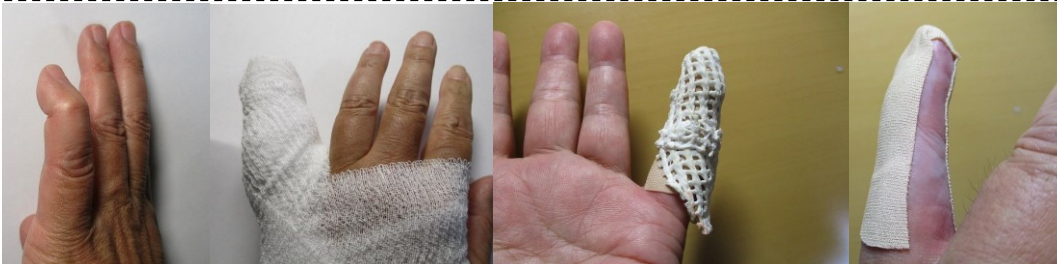
左手小指の腱を断絶(4~6月)・・・庭木を剪定中、小指を枝に引っ掛けた際に腱が切れ、第1関節が曲がったままに。固定しリハビリに1ヶ月半。輪ゴムと同様、身体の経年劣化を痛感！