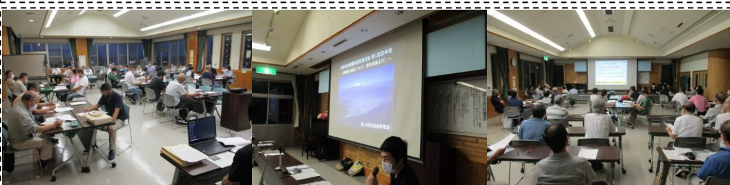
吉原高校避難所運営委員会総会(7/5)・・・昨年はコロナの影響で避難所開設・運営訓練が実施できませんでした。今年は新しい委員さんが多い中、何とか訓練を行いたいと思います！