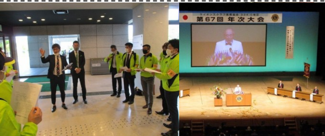
県内のライオンズクラブ年次大会(4/18)・・・富士市内の5クラブがホストの形で開催。私はロゼ北側でバス乗降所の案内係を務めました！