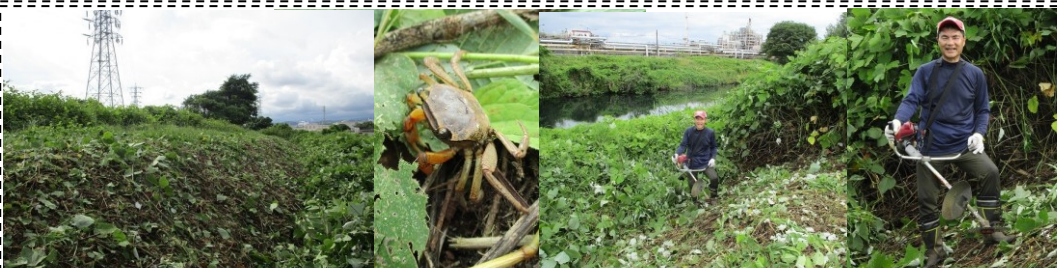
夏に備えた滝川の土手普請(6/19)・・・「そうだ！沼川プロジェクト」メンバーでの草刈りは、前の週が雨で中止になったので、この日2人で刈りました。この時期は茎がみるくサクサク刈れます！