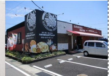
まちなかラボ キックオフイベント(5/20)・・・ピザ食べ放題の「パタパタ」を経営する茅原社長の取組みと、市役所南側に出店した冷凍テイクアウトの「KAYAHARA SYOUTEN」にも注目！