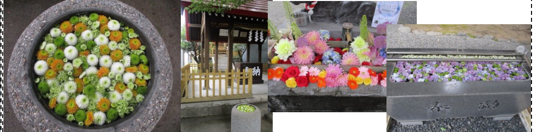
おてんのさんの六社詣で～花手水(はなちょうず)めぐり～(6/12)・・・2年続けて中止になった吉原祇園祭の6神社の手水に花を生け、コロナ収束を祈願し参詣する爽やかで粋な取組みです！