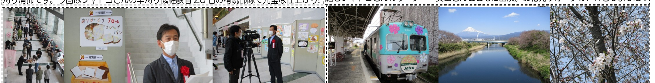
「ありがとう富士製パン アート&手紙コンクール」(3/27)…70年にわたり学校給食のパン、やご飯を作ってきた富士製パンさんが撤退したことを受け、有志の皆さんが企画。残念です！ お花見ウォークのコースをソロウォーク(3/27)…東田子の浦駅から沼川、滝川、田宿川沿いを、行く 8km のコースです。岳鉄はサクラ電車ですが、本物のサクラはまだ 2~3 分咲きでした！