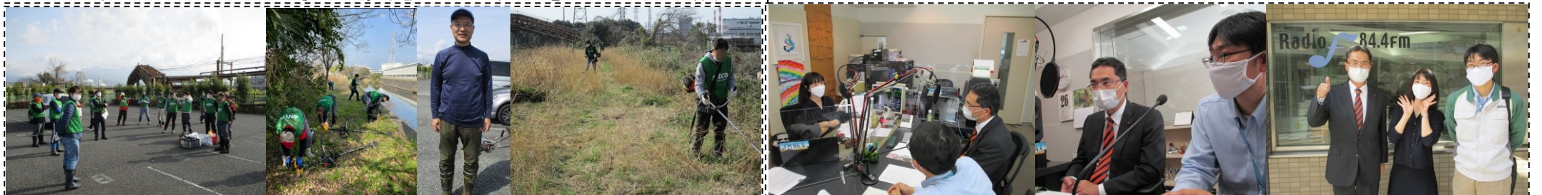
お花見の時期に備えた滝川の土手普請(3/20)…「そうだ！沼川プロジェクト」で取り組む草刈り清掃です。今回はジャトコさんの草刈り機経験者 23 名の精鋭部隊で完璧な仕上がりに！ ラジオ f の「グリーン＆ブラウン」に出演(3/26)…「そうだ！沼川プロジェクト」に一緒に取り組むジャトコさんのリーダー・奥さんとも出演。お花見ウォークのPRをしました！