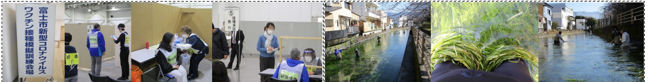
新型コロナウイルスワクチン接種模擬訓練(3/7)…医師会、薬剤師会、富士市、田子浦地区の皆さんが参加し、会場となる「ふじさんめっせ」で実施。明確になった課題を踏まえ万全な接種体制を！ 今年最初の田宿川の川そうじ(3/14)…この数年、冬にやってくる渡り鳥・オオバンが、上流側(水の上、仲町等)の水草をきれいに食べてくれますが、下流の田宿町区間はまだまだ人手が必要です！