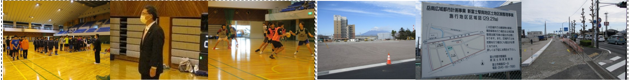
富士高ハンドボール部の初投げ(1/3)…毎年恒例の行事ですが、今年はコロナの中、帰省等が難しい大学生以上の参加は断念し、現役高校生と市内の中学生チームによる練習試合を実施！ 新富士駅南地区土地地区画整理事業の進捗確認(2/23)…区域東側は新たな道路が整備され住宅も数多く建ち始めています。今後は新富士駅南口周辺の商業・業務エリアを注視です！