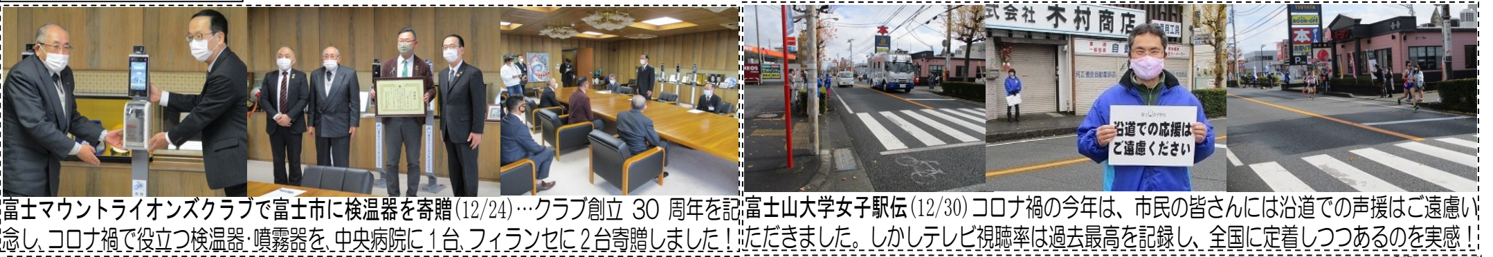
富士マウントライオンズクラブで富士市に検温器を寄贈(12/24)…クラブ創立 30 周年を記念し、コロナ禍で役立つ検温器、噴霧器を、中央病院に 1 台、フィランセに 2 台寄贈しました！ 富士山大学女子駅伝(12/30) コロナ禍の今年は、市民の皆さんには沿道での声援はご遠慮いただき、テレビ視聴率は過去最高を記録し、全国に定着しつつあるのを実感！