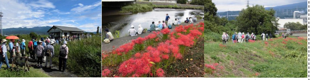
雨上がりの中歩いていただいたヒガンバナウォーク (9/23) ...昨年は時期が早過ぎましたが、今年はかなり蒸し暑い中、満開のヒガンバナを楽しんでいただけました！