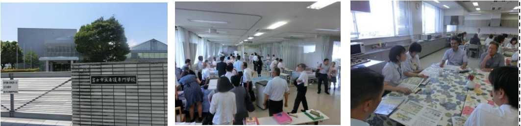
議会有志で富士市立看護専門学校を視察 (7/10) ...初めて看護専門学校を視察しました。開校後 25 年が経過し、校舎や設備の老朽化対策等が急務です！