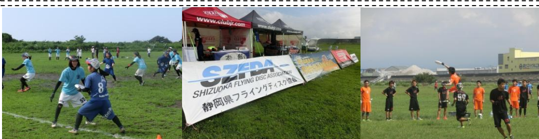
第 2 回静岡県アルティメット選手権 (8/19) ...正式？別名は？「富士山杯争奪 究極円盤選手権」。県内の大学、社会人 12 チーム、140 人が熱戦を繰り広げました！