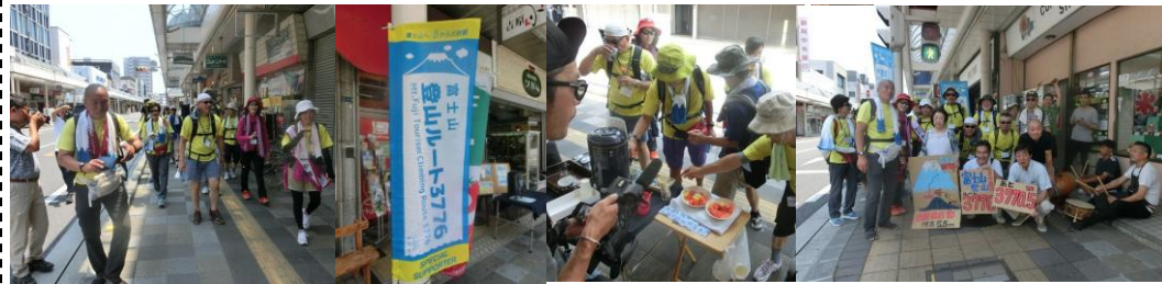
富士山登山ルート 3776 ツアーをお出迎え (7/8) ...「かぐや姫の富士山への里帰り」をテーマにした 3776 ツアーの皆さんを吉原商店街で出迎えました！