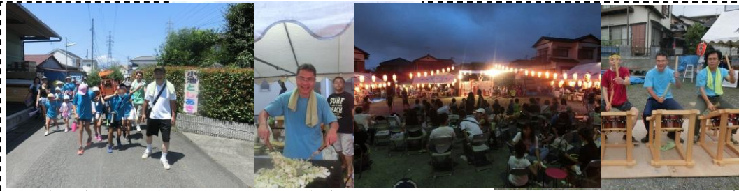
今年も完全燃焼・駿河台三丁目の天王祭 (7/15) ...太鼓はいまだに上手く叩けません。今年もフル回転しました。翌日の片付けでは「熱中症」になるオマケ付きでした！