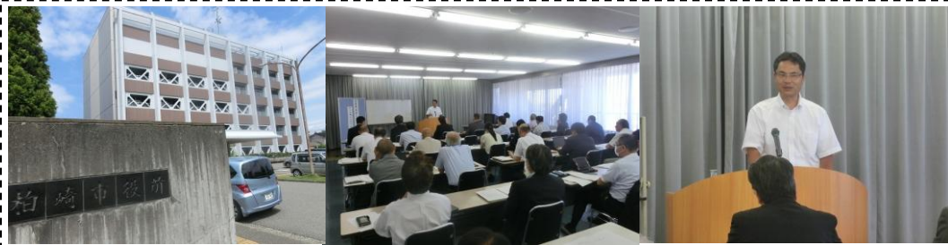
富士市議会の「事業評価」の取組みを柏崎市議会 (新潟県) で講演 (8/10) ...議会の決算委員会委員長として伺いました。柏崎市議会の皆様と良いご縁ができました！