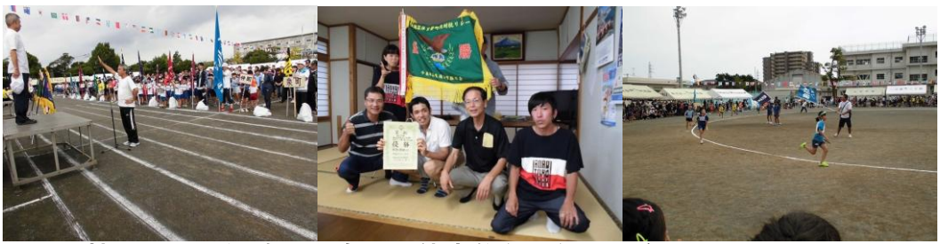
町内対抗リレーは優勝！今泉地区体育祭 (9/24) ...私が住む駿河台三丁目は、リレーはぶっちぎりの優勝でした。グラウンドも、「祓いの席」も大盛り上がりでした！