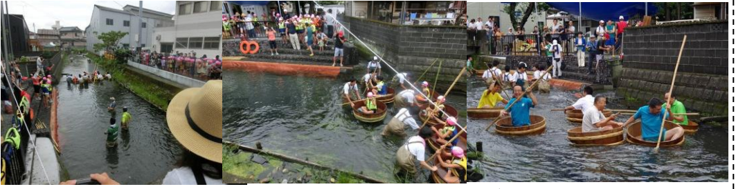
市長と議員の醜い沈没合戦・田宿川たらい流し川祭り (7/30) ...県外からもカメラマンが訪れるようになりました。でもこの姿は、とても子ども達には見せられない？