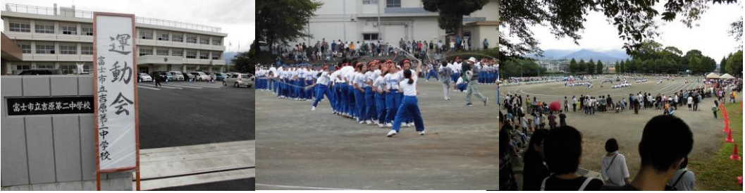
雨の中でも頑張った吉原二中の運動会 (9/16) ...台風が接近する中、難しい判断の開催でした。雨が強くなり、一部順延もありましたが、記憶に残る運動会になった？