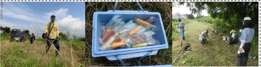
ヒガンバナウォークに向けた滝川の草刈り清掃 (7/22・9/2) ...ヒガンバナがきれいに見えるよう「夏の草刈り」が欠かせません。休憩時間のアイスが楽しみです！