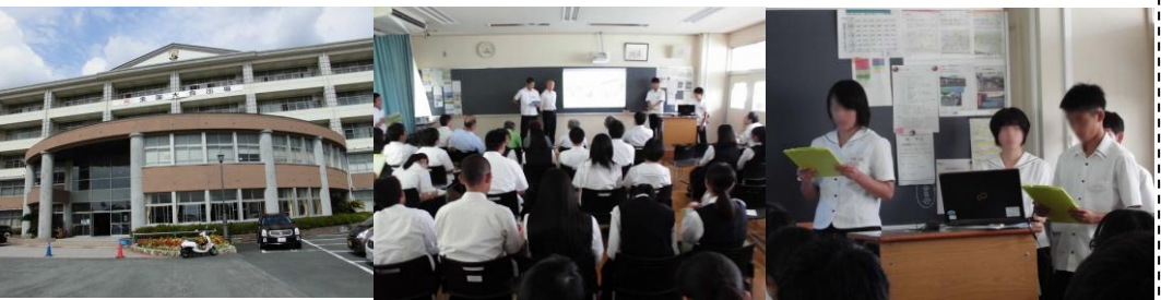
富士市立高校「究タイム」発表会 (9/27) ...2 年生が半年かけて、市内各地区の特徴を活かした「活性化プラ」を提案しました。是非「思い」を「形」にしてほしい！

● ブログ (インターネット上の日記) を覗いて見て下さい。ほぼ毎日更新しています。検索は「小池としあき」で！ ( https://koike473.exblog.jp/ ) ●