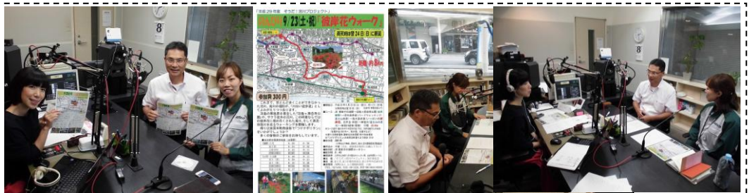
ヒガンバナウォークの PR でラジオ f に出演 (9/8) ...千野真紀さんの的確なリードで、ジャトコの地域貢献担当の佐伯さんとともにコースの見どころ等を紹介しました！