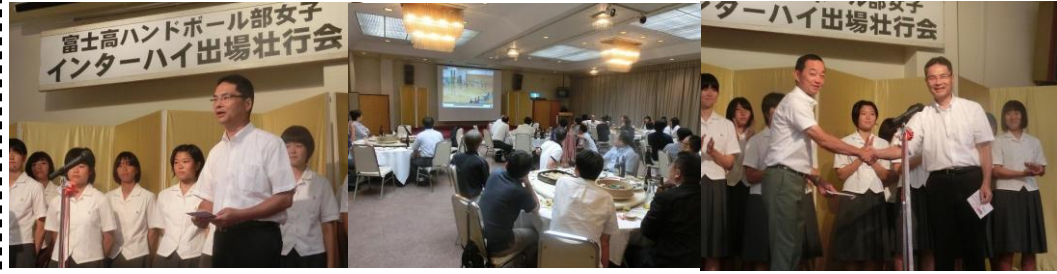
富士高女子ハンドボール部が 2 年連続インターハイ出場 (7/23) ...今年も 3 年生は自分達のチームになってから「県内負け無し」の快挙です。男子も久々に県 3 位になりました！