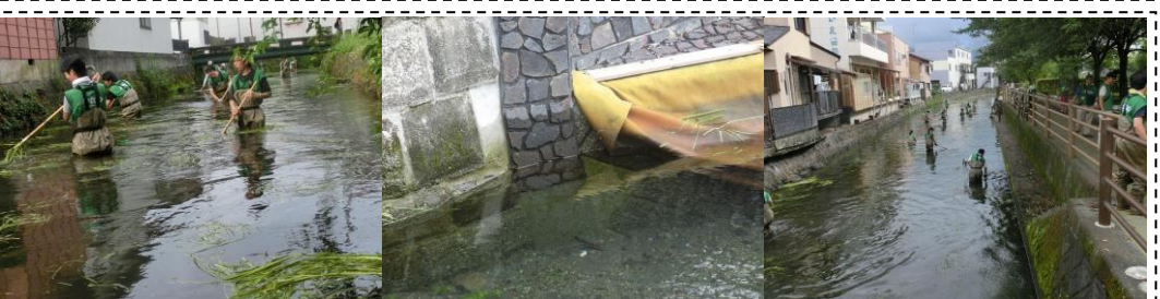
久々に田宿川に入っの川そうじ (8/20) ...夏の間、田宿川の水草は 1 ヶ月で 1m 以上成長します。これを刈ると水位が 30 cm 程下がり、安全が保たれます！