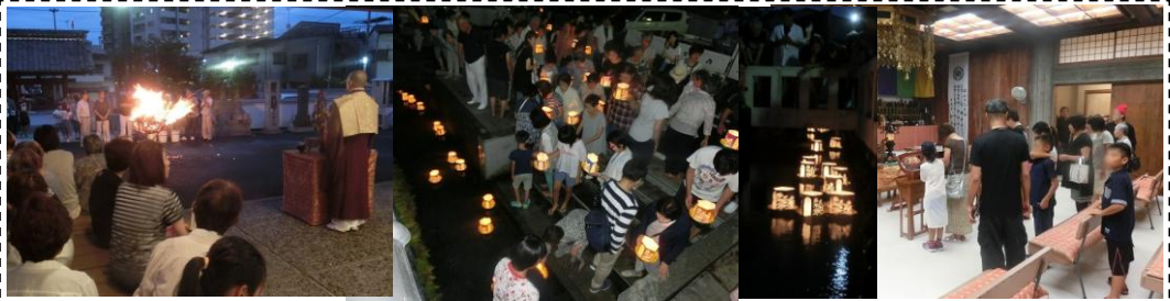
お盆の最後を飾るわきみず寺 (法雲寺) の灯籠流し (8/16) ...「お焚き上げ」の後、境内を流れる「わきみず」の水路に灯籠を流します。ご先祖様に改めて感謝です！