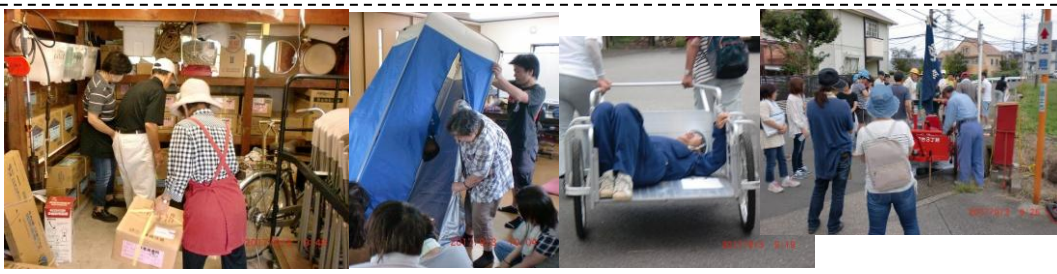
駿河台三丁目の夏季防災訓練 (9/3) ...半数以上が入り替わった自主防災委員が、備蓄品のチェックや資機材の使い方確認を。私は負傷者役でリカで運ばれました！